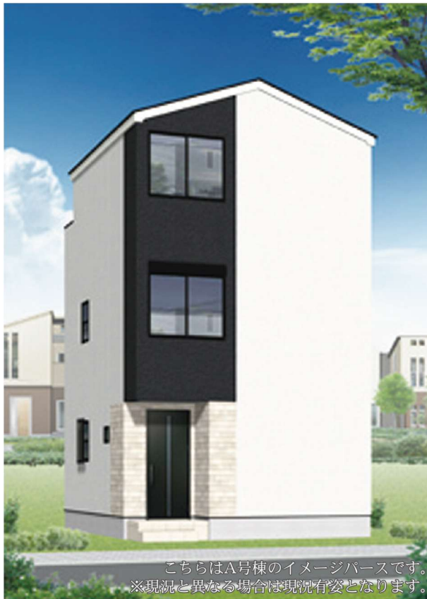
こちらはA号棟のイメージバースです。 ※現況と異なる場合は現況有姿となります。

駅徒歩10分の好立地。駅に隣接のショッピングモールで日々のお買物も充実。近隣に金融機関や病院、図書館なども集まる利便性の高いエリアです。駅南側の「辻堂海浜公園」はジャンププールが人気。サーフィンスポットも近い。