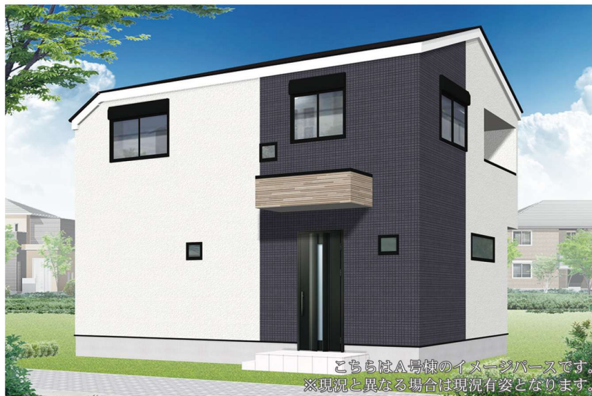
こちらはA号棟のイメージパースです。 ※現況と異なる場合は現況有姿となります。

2路線2駅利用可能な好立地。駅徒歩10分で通勤・通学に便利です。 2駅共に周辺にスーパーなどの生活利便施設や教育機関が点在する。 バス便も豊富で「瀬谷駅」方面に向かう発着便があります。