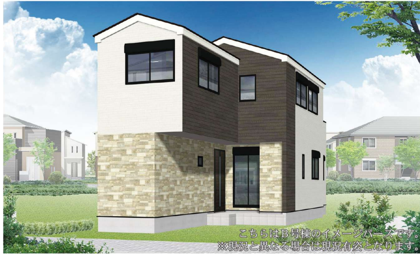
こちらはB号棟のイメージパースです。 ※現況と異なる場合は現況有姿となります。

駅周辺は閑静な住宅街が広がる。 複数の教育機関が立地しており、文教地区の一面を併せ持つ。 三溪園や駅西側の「根岸森林公園」、東側の「本牧山頂公園」など 潤いある自然を身近に感じるエリア。