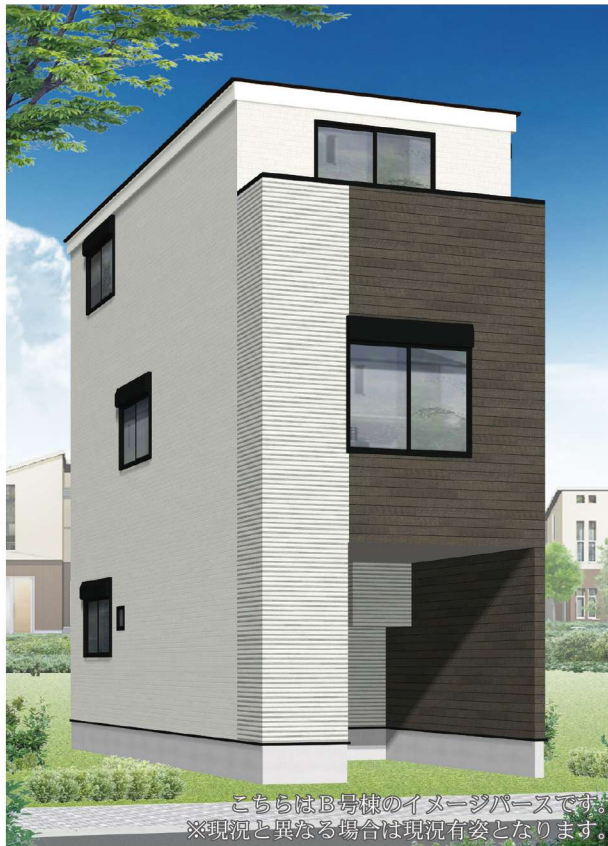
こちらはB号棟のイメージパースです。 ※現況と異なる場合は現況有姿となります。

自然と都市機能が調和した街「中希望が丘」。「希望ヶ丘」駅が徒歩圏内と近く通勤通学も快適です。豊かな自然に恵まれた潤いあるロケーション。