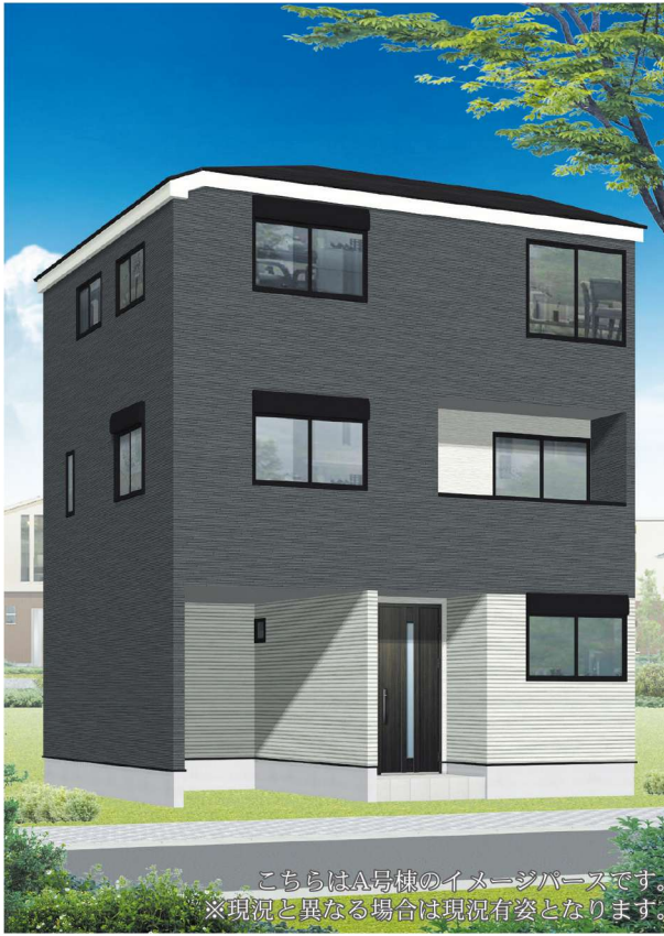
こちらはA号棟のイメージパースです。 ※現況と異なる場合は現況有姿となります。

駅周辺には、スーパーやコンビニ、生活利便施設が点在し、毎日の暮らしを快適にサポートしてくれます。