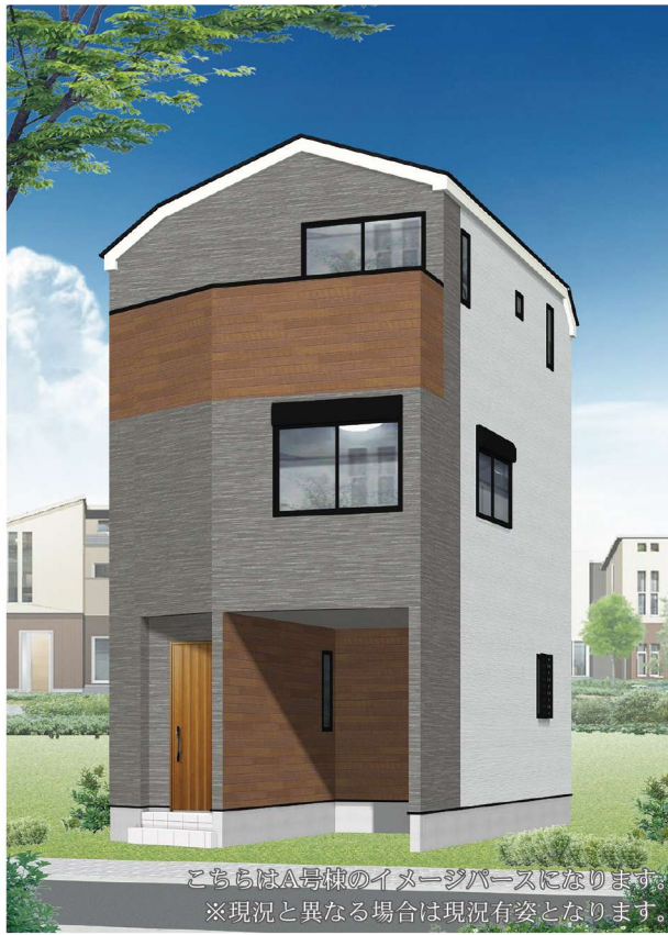
こちらはA号棟のイメージパースになります。 ※現況と異なる場合は現況有姿となります。

京王線と南武線の2路線利用可能な好立地。「京王稲田堤」駅と「稲田堤」駅を結ぶ「京王駅前通り商店街」には様々な店舗や飲食店が立ち並びんでいます。