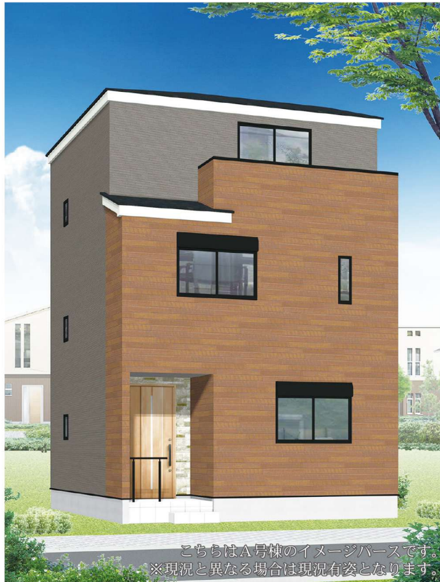
こちらはA号棟のイメージパースです。 ※現況と異なる場合は現況有姿となります。

A号棟 土地面積 73.80m 2 建物面積 97.15m 2 4LDK ■建築確認番号/第2023SBC-確00206号 ■販売価格 5,580万円 5,480万円 (税込)