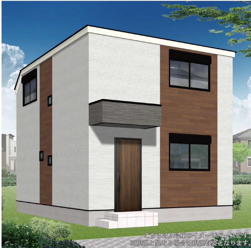
こちらはA号棟のイメージパースです ※現況と異なる場合は現況有姿となります。

A号棟 土地面積 103.33㎡ 建物面積 82.85㎡ 備蓄倉庫面積0.82㎡含む ■販売価格 5,280 万円 3LDK +カースペース1台 ■建築確認番号/第2023SBC-確00923Y号 5,080 (税込) 万円