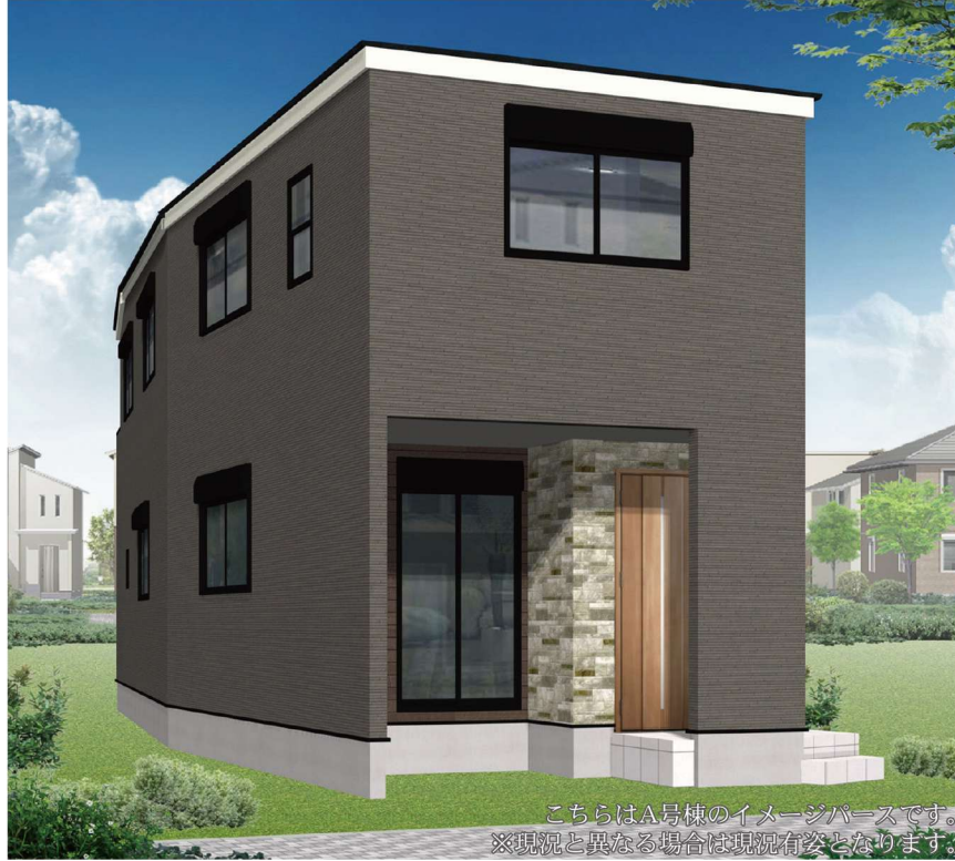
こちらはA号棟のイメージパースです。 ※現況と異なる場合は現況有姿となります。