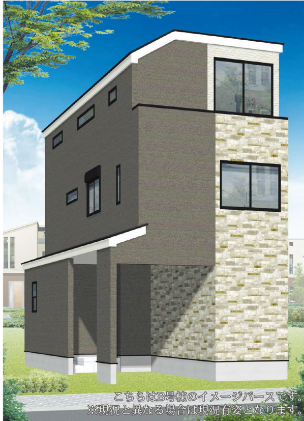
こちらはB号棟のイメージパースです。 ※現況と異なる場合は現況有姿となります。

「西横浜」駅は「横浜」駅まで2駅約4分でアクセスでき、通勤・通学に大変便利な最寄駅です。周辺には「藤棚商店街」をはじめ5つの商店街が連なっており、約200以上の多彩な店舗が揃っています。区役所や保育園・小・中・高等学校など教育機関も周辺に立地、また国道が分岐する交通の要衝でもあります。