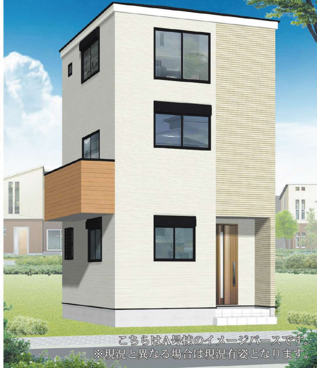
こちらはA号棟のイメージです。 ※現況と異なる場合は現況有姿となります。

矢野口駅周辺には、多摩川が流れており、川沿いを散歩することができます。また、駅前には商店街があり、飲食店や雑貨店などが軒を連ねています。生活利便と快適が備わった暮らしやすいロケーション。