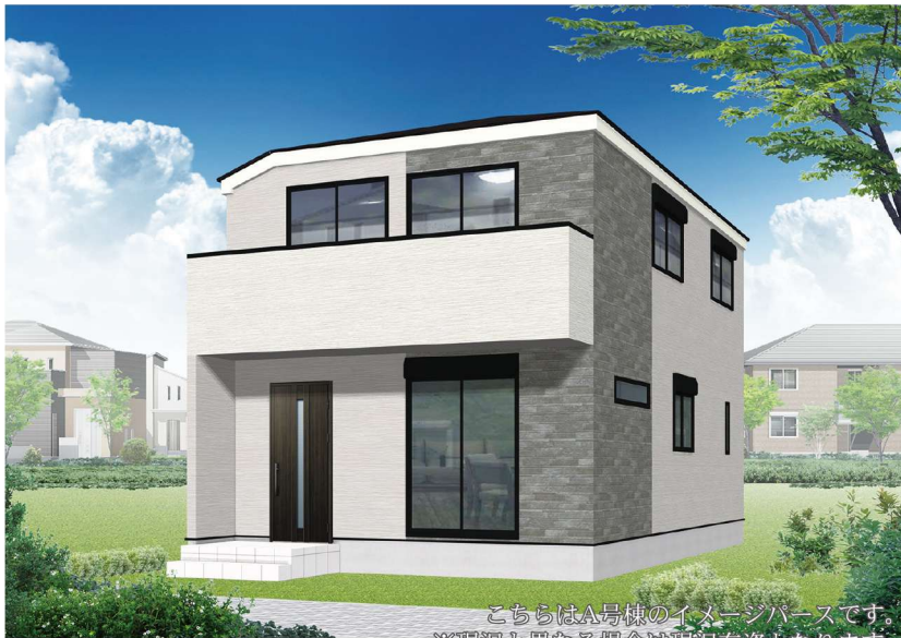
こちらはA号棟のイメージパースです。 ※現況と異なる場合は現況有姿となります。