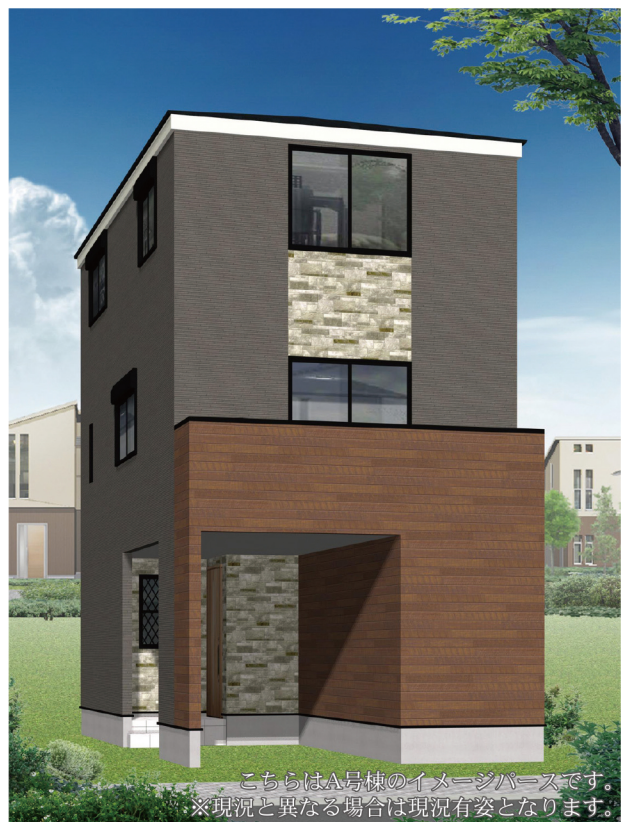
こちらはA号棟のイメージパースです。 ※現況と異なる場合は現況有姿となります。

駅前には再開発で商業施設などの買い物スポットが揃う「鹿島田」 乗換なしで「川崎」駅や「武蔵小杉」駅に約6分で行くことができます。