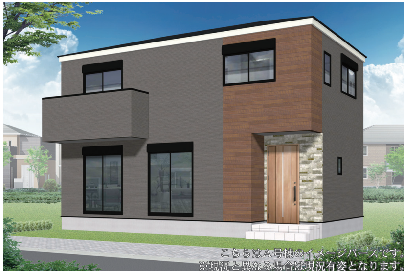
こちらはA号棟のイメージパースです。 ※現況と異なる場合は現況有姿となります。

2路線2駅利用可能な好立地。通勤・通学に良好なアクセス。 「恩田駅」周辺は閑静な住宅街が広がり、公園が多数点在する。