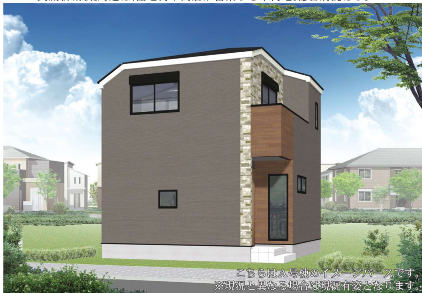
こちらはA号棟のイメージパースです。 ※現況と異なる場合は現況有姿となります。

2駅利用可能な好立地!通勤・通学に便利な交通アクセス。 「武蔵新城駅」周辺は、住宅街や商店が密集する市街地。総合病院あり。