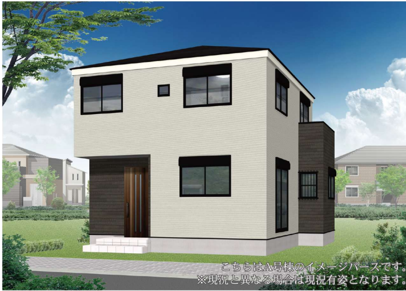
こちらはA号棟のイメージパースです。 ※現況と異なる場合は現況有姿となります。

A号棟 土地面積 100.52㎡ ■販売価格 4LDK 建物面積 92.74㎡ 5,780 (税込) 万円 +カースペース1台 ■建築確認番号/第2023SBC-確01671Y号