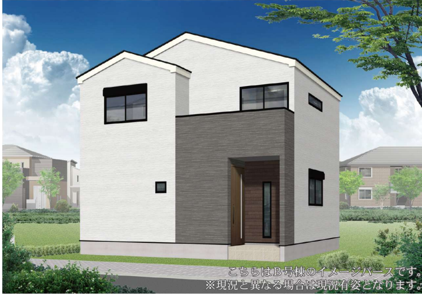
こちらはB号棟のイメージハウスです。 ※現況と異なる場合は現況有姿となります。

川崎駅まで電車で片道25分という好立地。駅前は府中街道が通っており、車の往来が多い。一方、駅の近くに公園が点在している自然豊かなエリア。