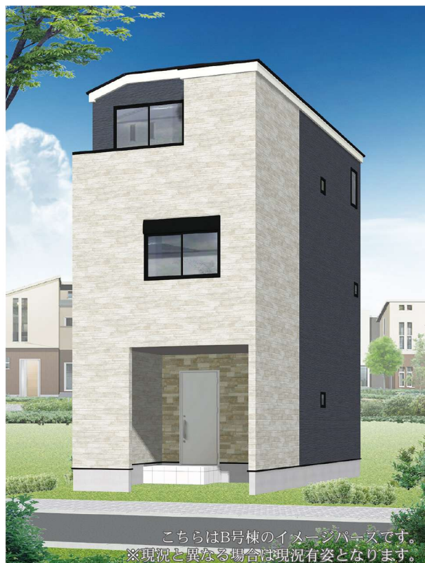
こちらはB号棟のイメージパースです。 ※現況と異なる場合は現況有姿となります。

JR横須賀線「新川崎」駅徒歩圏。周辺はタワーマンションをはじめとする高層住宅や再開発ビルが林立。教育機関や公園が点在。