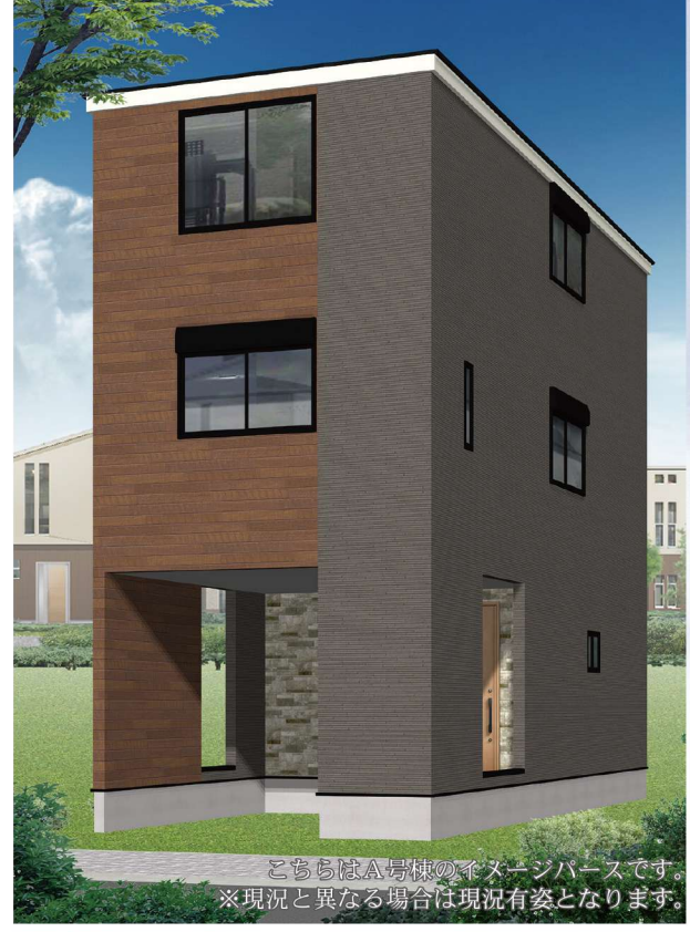
こちらはA号棟のイメージです。 ※現況と異なる場合は現況が姿となります。

複数路線3駅利用可能で通勤・通学に便利なエリア。 コンビニ・スーパー至近につき日常のお買物に便利。