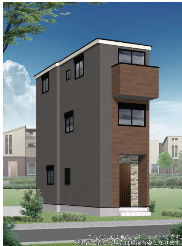
こちらはA号棟のイメージパースです。 ※現況と異なる場合は現況有姿となります。

「地域子育て支援センター」至近！医療機関充実で子育てに最適。 2駅利用可能な好立地！