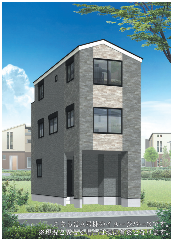
こちらはA号棟のイメージパースです。 ※現況と異なる場合は現況有姿となります。

2路線・2駅利用可能な好立地のため通勤・通学に便利です。「五反野駅前通り商店街」や「青井兵和通り商店街」など、日々の買い物に便利な生活利便施設が充実するエリアです。