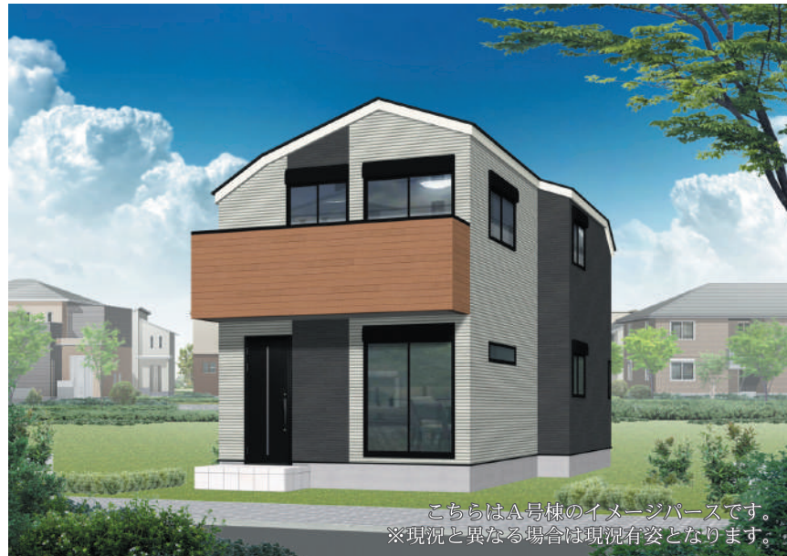
こちらはA号棟のイメージパースです。 ※現況と異なる場合は現況有姿となります。

A号棟 4LDK +カーサベース2台 土地面積 101.06㎡(公簿) 建物面積 93.16㎡ ■建築確認番号/ 第2023SBC-確02553Y号 ■販売価格