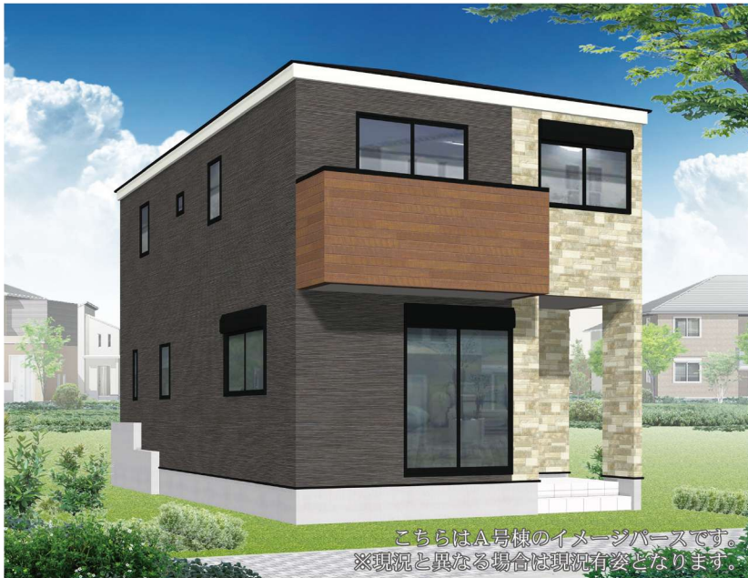
こちらはA号棟のイメージパースです。 ※現況と異なる場合は現況有姿となります。

「読売ランド前」駅は渋谷まで所要時間34分の好アクセスな駅です。 のんびりした雰囲気の丘陵地帯で公園も多くあります。