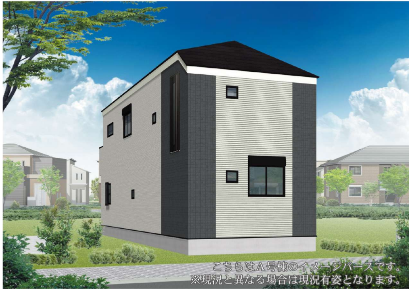
こちらはA号棟のイメージハウスです。 ※現況と異なる場合は現況有姿となります。

落ち着いた教育環境が整い、自然豊かな心地良いエリアです。 幼稚園なども点在しており、お子様にも安心の住環境です。