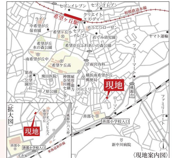
カーナビ: 横浜市旭区南希望が丘30-7

【物件概要】 ■所在地/横浜市旭区南希望が丘30番7・8 ■構造規模/木造2階建 ■土地権利/所有権 ■地目/宅地 ■都市計画/市街化区域 ■用途地域/第1種低層住居専用地域 ■建蔽率/50% ■容積率/100% ■公法制限/第1種高度地区・準防火地域 ■接道状況/南東側幅員約4.6m公道 ■完成/2024年10月予定 ■引渡/2024年11月以降 ■設備/公営水道、都市ガス、東京電力、公共下水 ■当社指定の司法書士及び土地家屋調査士になります。 ※建物表示登記費用110,000円(税込)が必要になります。 ※フラット35S(金利Bタイプ)利用の場合、別途申請費用110,000円(税込)が必要になります。 ※図面と現況が異なる場合は現況優先と致します。 ※完成及び引渡は着工時期により変更になります。 担当へ確認ください。 ※外構標準仕様はカースペース1台となります。 ※瑕疵保険及び第三者建物検査会社に変更になる場合があります。