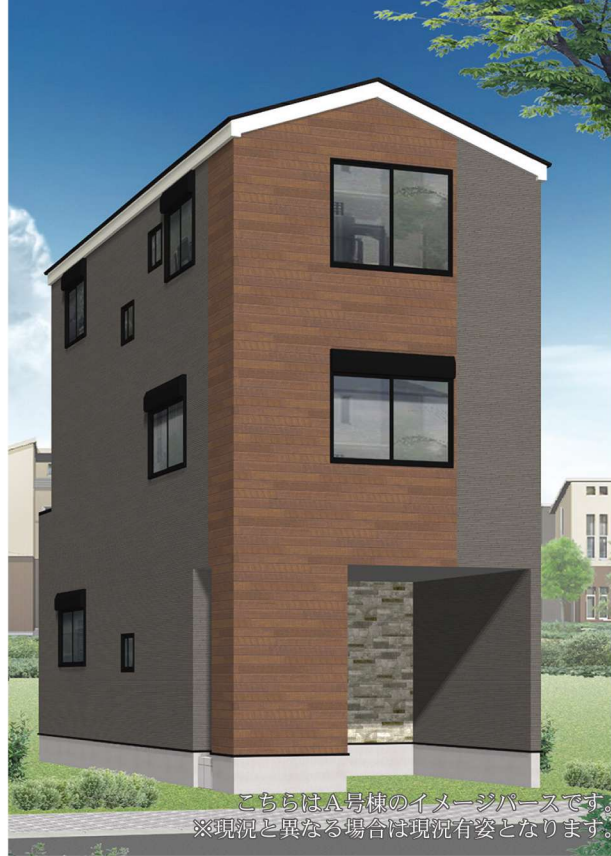
こちらはA号棟のイメージパースです。 ※現況と異なる場合は現況有姿となります。