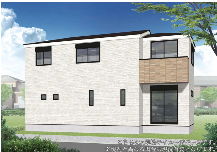
こちらはA号棟のイメージパースです。 ※現況と異なる場合は現況有姿となります。