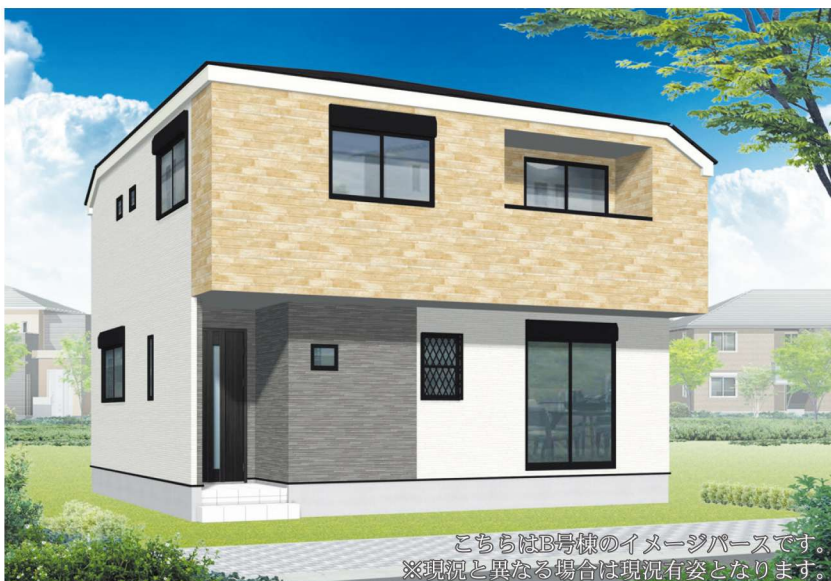
こちらはB号棟のイメージパースです。 ※現況と異なる場合は現況有姿となります。

A号棟 土地面積 118.93m 2 建物面積 95.22m 2 4LDK +カースペース2台 ■建築確認番号/第2023SBC-確01349Y号 ■販売価格 5,680 (税込) 万円 5,880万円